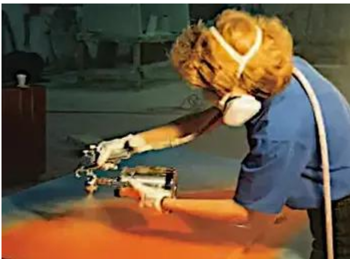
Figure 5 : Faites passer le tuyau d'air par-dessus votre épaule afin qu'il ne traîne pas sur la surface fraîchement peinte.

Pendant la pulvérisation, vous rencontrerez des problèmes, les plus courants étant les coulures et les affaissements.