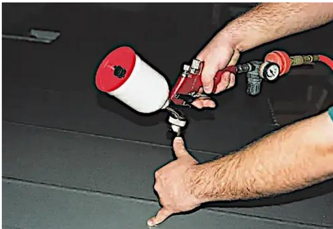
Figure 3 : Utilisez vos doigts écartés pour estimer la distance correcte entre la buse du pistolet à air et le matériau que vous pulvérisiez.

Appuyez sur la gâchette juste avant de commencer le passage de peinture, et relâchez-la juste après l'avoir terminé. Déplacez ensuite le pistolet vers le haut ou vers le bas d'environ la moitié de la largeur de l'éventail et commencez le passage suivant. Pour obtenir une couche de peinture uniforme, vous devez chevaucher chaque passage d'environ la moitié de la largeur de l'éventail. Il est également important de relâcher la gâchette à la fin de chaque passage tout en déplaçant le pistolet vers la position de chevauchement. Ne pas le faire appliquera plus de peinture que nécessaire à la fin du passage, ce qui entraînera une coulure ou un affaissement.