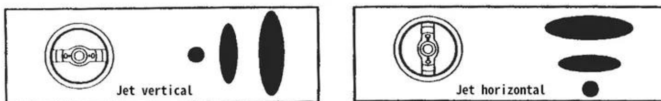
Figure 2 : Le réglage du diffuseur modifie l'éventail de pulvérisation de vertical à horizontal. La direction de l'éventail doit être perpendiculaire à la direction de déplacement du pistolet.

Remarquez le diffuseur d'air dans la Figure 2. Le fait de le tourner modifie l'éventail de pulvérisation de vertical à horizontal, et la direction de l'éventail doit être perpendiculaire à la direction de déplacement du pistolet. Utilisez un éventail vertical lorsque vous pulvérisez horizontalement et un éventail horizontal lorsque vous pulvérisez verticalement. Assurez-vous d'utiliser la buse correcte. En général, les revêtements à faible viscosité nécessitent une buse plus petite, et les revêtements à viscosité élevée une plus grande. Le fabricant du pistolet de pulvérisation recommandera des buses pour différents types de matériaux.