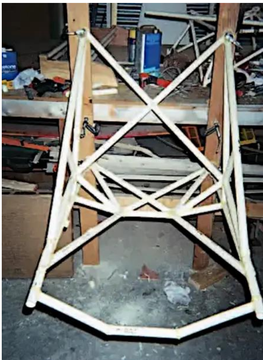
Une fois la conception du bâti moteur terminée, la maquette en tuyaux d'eau en PVC est montée sur un châssis en bois pour les essais de charge. La conception du bâti semble correctement contreventée.